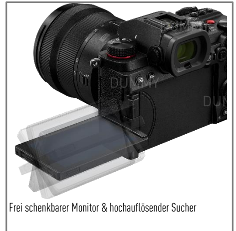
Frei schenkbare Monitor & hochauflösender Sucher

Die LUMIX S5 verbindet Foto und Video in Perfektion. Zusammen mit dem neuen Autofokus, dem robusten Magnesiumgehäuse und nicht zuletzt der Kompaktheit macht sie das zum idealen Begleiter für Fotografen und Videografen, die keine Kompromisse wollen.