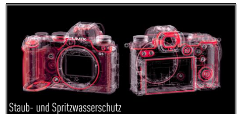
Staub- und Spritzwasserschutz