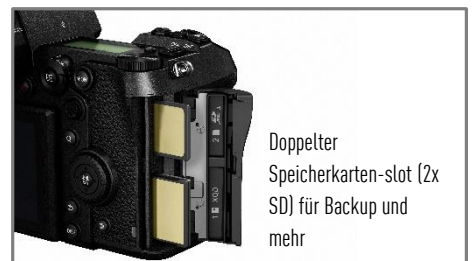
Doppelter Speicherkarten-slot (2x SD) für Backup und mehr