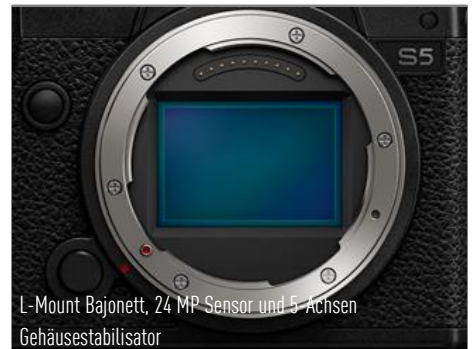
L-Mount Bajonett, 24 MP Sensor und 5-Achsen Gehäusestabilisator

DC-S5KE-K I 5025232940080 (S5 Body + R2060) | UVP Deutschland 2.241,04 € inkl. 16% MwSt., UVP Österreich 2.299 € inkl. 20% MwSt.