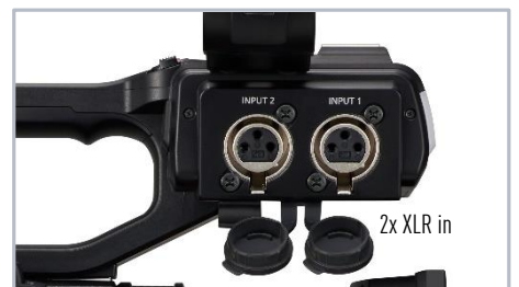
2x XLR in